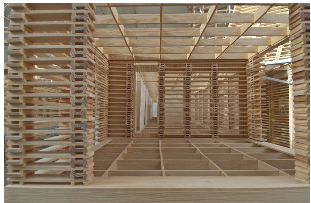
Medinio karkaso pavyzdys

Poilsio namelio konstrukcija - medinis karkasas. Siūloma apie liepą, augančią tarp ąžuolų, įrengti keturis medinius stulpus, ant jų tvirtinti medines sijas, kurios laikytų namelio karkasą. Taip pat keturi mediniai stulpai įrengiami apie ąžuolą, augantį į pietus nuo liepos. Ant šių stulpų montuojamos medinės sijos, kurios laikys terasos grindis.