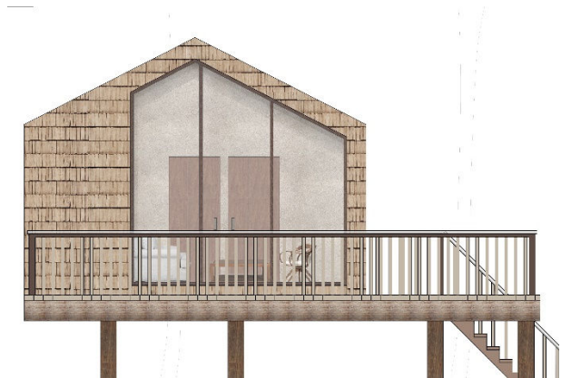
Poilsio namelio siluetas

Namelio siluetas tradicinio dvišlaičio medinio namo, kuris dera prie greta esančio Nykštukų miestelio namukų.