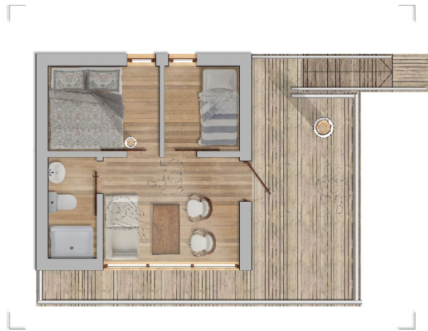
Poilsio namelio planas

Nuo viršutinės terasos tako į namelį ves laiptai. Laiptais poilsiautojas galės pakilti į nedidelę terasą, apkabinusią vieną iš ąžuolų ir pradingti jo šakose. Terasoje jis ras duris, kurios pakvies į namelio vidų. Namelio planas aiškios formos, optimalaus dydžio (bendrasis plotas – 21,5 kv. m.). Poilsio namelis medyje sukurtas vienos šeimos trumpalaikiam poilsiui. Pro duris poilsiautojas pateks į nedidelę jaukią svetainę, kurioje jį sužavės vaizdas atsiveriantis pro didelį langą vakariniame fasade. Namelio gyventojai galėtų mėgautis pro medžių šakas atsiveriančiu vaizdu į tvenkinį, o naktį tikėtis išvysti dinozaurą galvą. Iš svetainės durys veda į tėvų miegamąjį, vaikų miegamąjį ir san. mazgą.