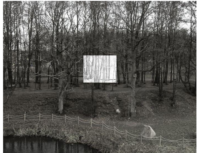
Poilsio namelio vieta

Namelis įkomponuotas tarp dviejų ąžuolų. Per vidurį tarp ąžuolų auganti liepa tampa namelio interjero elementu.